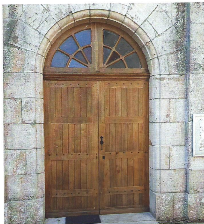
La porte de l'église de Magnagues : on la croirait neuve !

La porte de l'église aussi a meilleure mine, elle a été nettoyée et repeinte !