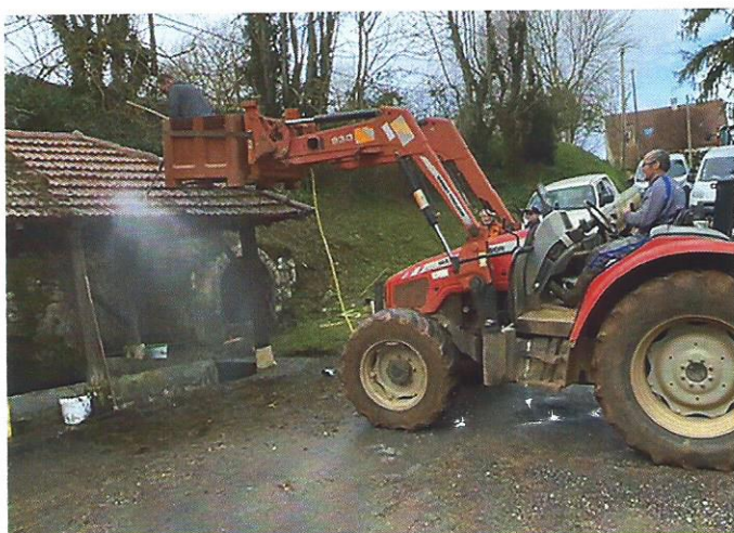
lavoir de Simon pendant le nettoyage

Vous vous souvenez que nous avons fermé les baies du clocher par du grillage ? et bien ils envahissent à présent le toit du château et les jours d'escaliers de l'église... ils dorment même sur les rebords des corbeaux de la bretèche d'entrée du prieuré. Ils pensent sans doute que ces pierres nommées « corbeaux » sont réservées aux volatiles ! et bien non ! Alors trois battues ont déjà été organisées pour procéder à leur élimination. Un grand merci aux piégeurs agréés de l'Association de chasse communale !