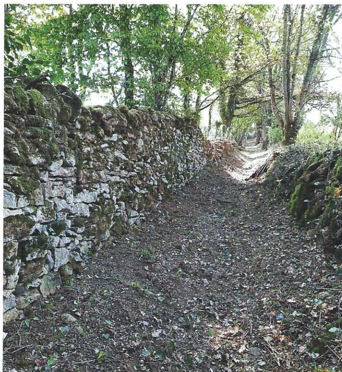
Réouverture du chemin de la croix Notre-Dame à Fleyt