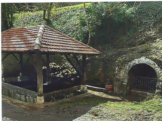
lavoir après le ménage