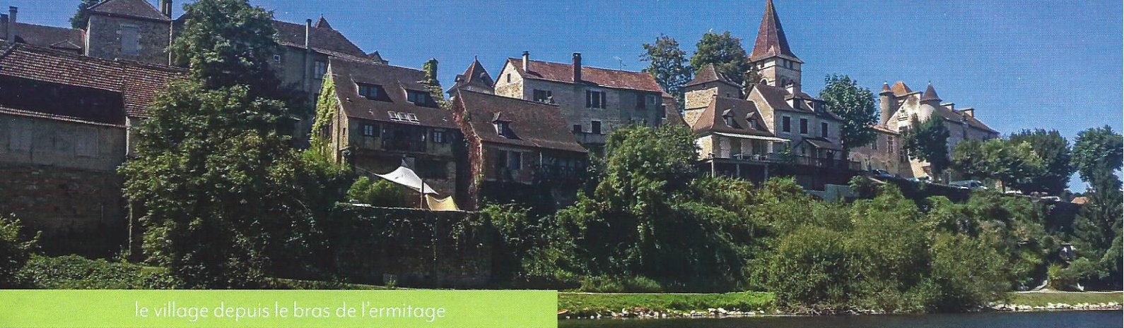
le village depuis le bras de l'ermitage

onéreux, lors des deux prochaines réunions du Comité de pilotage, d'ici l'automne 2021, pour des travaux prévus en 2023. Ces travaux et l'entretien futur nécessitent un engagement politique de long terme. La communauté de communes Causses et vallée de la Dordogne, consciente de l'intérêt patrimonial de Carennac est prête à soutenir financièrement ce projet de restauration, indispensable au maintien du passage de l'eau au pied du village. C'est une chance pour notre commune qui ne pourrait pas seule subvenir à ce type de dépenses !