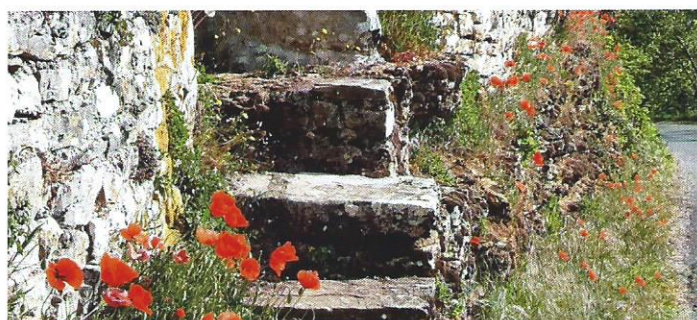
Quoi de plus beau qu'un mur en pierre sèche avec des coquelicots

le dessus sur nos belles idées ! certains nous demandent même quand nous inaugurerons la nouvelle mairie ! Hélas pour l'instant nous ne pouvons que rêver ! Souhaitons que lorsque ce journal paraîtra, la crise sanitaire sera en voie d'amélioration et que nous pourrions à nouveau envisager de tisser ces liens sociaux qui nous manquent tant !